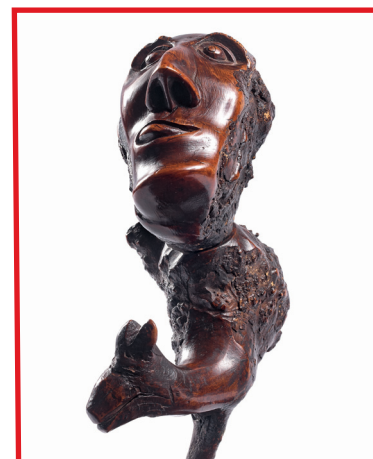
FOURNEAU DE PIPE en bruyère, sculpté d'une tête grotesque XIX e siècle

Cette coupe de chasse, datée de 1705, commémore vraisemblablement un mariage. Elle pourrait avoir appartenu à l'un des officiers de la famille de Courten, dont les armoiries apparaissent sur le corps de l'objet. (6 000 / 8 000 €)