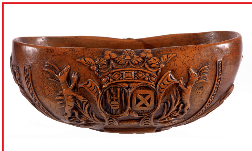
COUPE DE CHASSE Début du XVIII e siècle Estimation : 6 000 / 8 000 €

Le sanctuaire qui abrite ses trésors – une unique pièce – étonne le visiteur par l'entassement savant des objets rassemblés et séduit par la mise en scène poétique, au dialogue silencieux, qu'il a su composer.