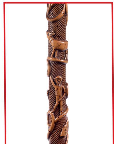
EXCEPTIONNELLE CANNE au chasseur en buis XIX e siècle Estimation : 3 000 / 5 000 €